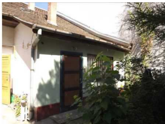
a lakás udvari homlokzata